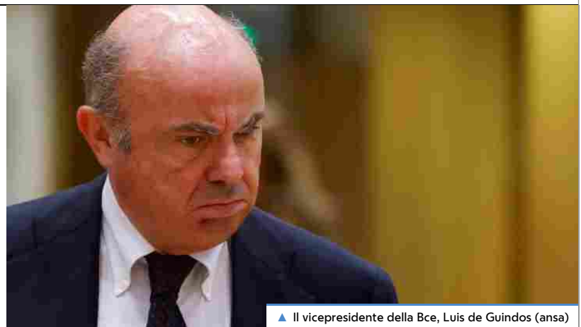
▲ Il vicepresidente della Bce, Luis de Guindos