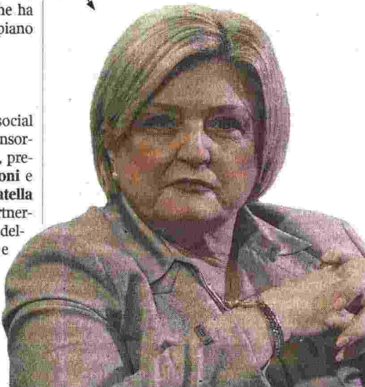
Marina Calderone Ministro del Lavoro sarà agli Stati Generali delle casse di previdenza private